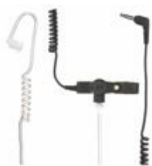
DWUPRZEWODOWA SŁUCHAWKA DOUSZNA 3,5 MM Z PÓLPRZEZROCZYSTYM FONOWODEM