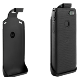
FUTERAŁ DLA LEX L11 Z TECHNOLOGIĄ TUNELOWANIA DŹWIĘKU