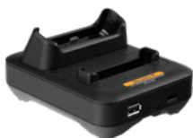
JEDNOSTANOWISKOWA ŁADOWARKA BIURKOWA

NIE ZWALNIAJ, PO PROSTU WYMIĘŃ ROZŁADOWANY AKUMULATOR NA NOWY