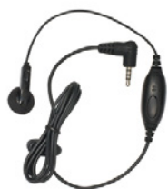
SŁUCHAWKA DOUSZNA 3,5 MM Z MIKROFONEM I PTT NA PRZEWODZIE