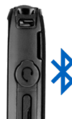
OBSŁUGA AKCESORIÓW 3,5 MM I BLUETOOTH INNYCH PRODUCENTÓW